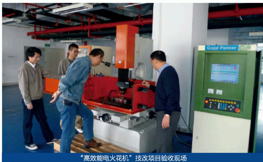
“高效能电火花机”技改项目验收现场